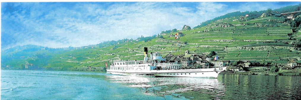
Momente des Geniessens: Schiffsausflug auf dem Genfersee.

Weitere Informationen: www.mittelthurgau.ch