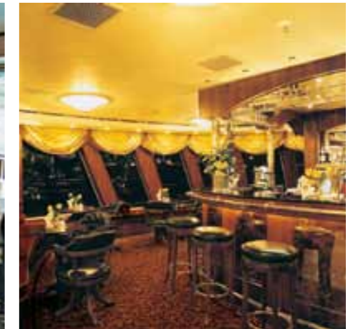
Zum Ausklang des Tages noch ein Abstecher in die Bar