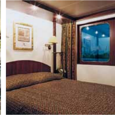
Gemütliche 2-Bett-Kabine Hauptdeck