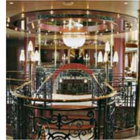
Willkommen an Bord!