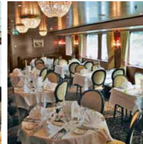
Nichtraucher-Restaurant mit stilvoller Note