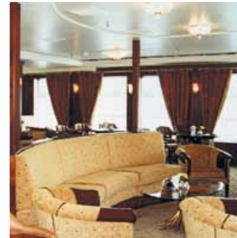
Gemütliche Stunden in der Lounge