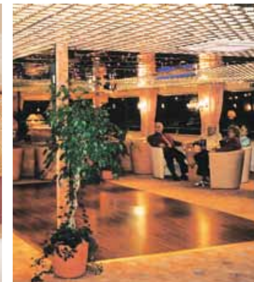
Die Lounge für gemütliche Abendstunden