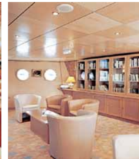
Die Bibliothek lädt zum Verweilen ein