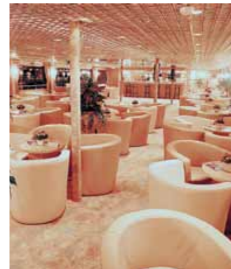
Gemütlicher Salon mit Bar