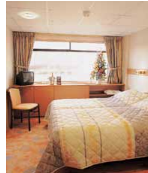
2-Bett-Kabine mit Panoramafenster