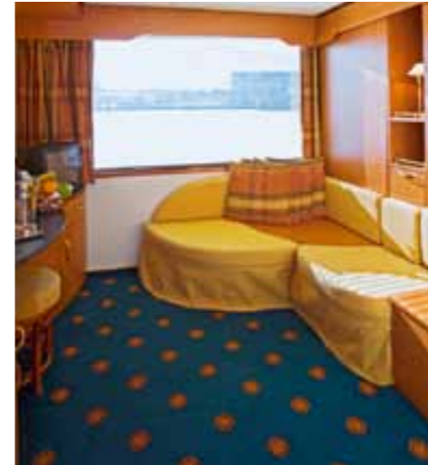
Komfortable 2-Bettkabine mit Panoramafenster