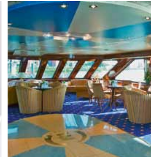
Gemütliche Stunden in der Panorama-Lounge