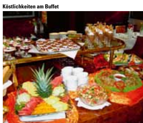
Köstlichkeiten am Buffet