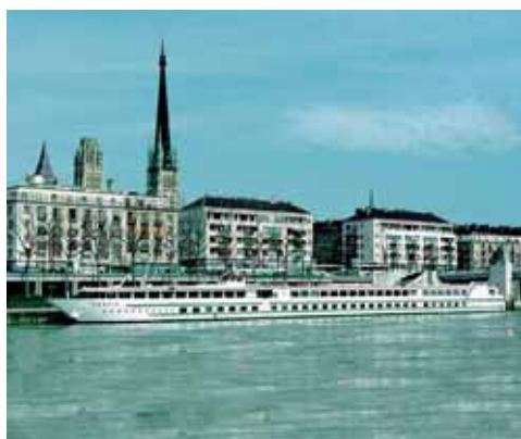
«MS Renoir» in Rouen

Im grosszügigen Restaurant erwartet Sie jeden Morgen ein Frühstücksbuffet. Mittags und abends werden Sie von der Küchenbrigade mit mehreren Gängen guter europäischer Küche mit landesüblichen Spezialitäten verwöhnt. Kaffee und Tee gegen Bezahlung. Zu den Mahlzeiten bieten wir Ihnen eine internationale und lokale Auswahl an Weinen an.