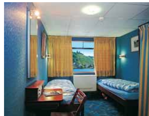
2-Bett-Kabine mit Panoramafenster

■ 2-Bett-Kabine mit Grandlit ■ 2-Bett-Kabine hinten ■ Einzelkabine ■ 2-Bett-Kabine ■ 3-Bett-Kabine