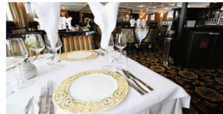
Kulinarik und Gaumenfreuden im eleganten Restaurant