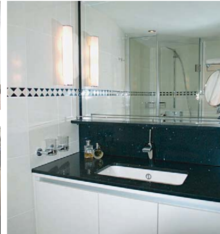
Grosszügiges Badezimmer mit Dusche/WC und viel Ablagefläche

Die einzigartige «Excellence Royal» setzt höchste Massstäbe. Für Ausstattung und Design wurden edle Materialien verarbeitet. Es erwarten Sie die grössten Kabinen auf einem Flussschiff in Europa überhaupt. 80 % der Zweibett-Kabinen sind 16 m 2 gross und mit französischem Balkon ausgestattet. Das Schiff besticht schon beim Eintreten durch ein grosszügig gestaltetes Foyer und gediegene Räumlichkeiten. Die «Excellence Royal» zählt zu den luxuriösesten Flussschiffen Europas und fährt unter Schweizer Flagge! Überzeugen Sie sich selbst vom hohen Komfort, dem besonderen Design, der exzellenten Küche und dem freundlichen Service. Sie werden ins Schwärmen kommen von diesem einzigartigen und unverwechselbaren Excellence-Schiffsprodukt!