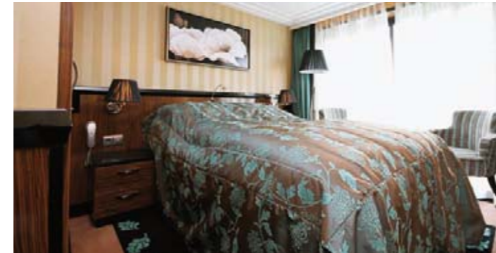
Luxuriöse 2-Bett-Kabine 16 m 2 mit frz. Balkon, Mittel- und Oberdeck