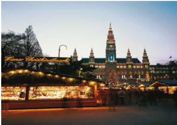
Zauberhafte Weihnachtsmärkte in Wien