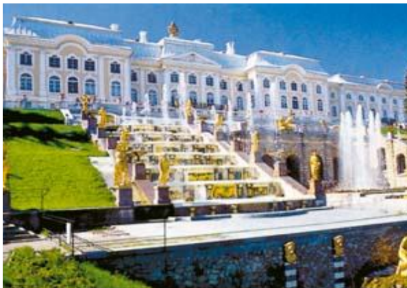
St. Petersburg – Peterhof